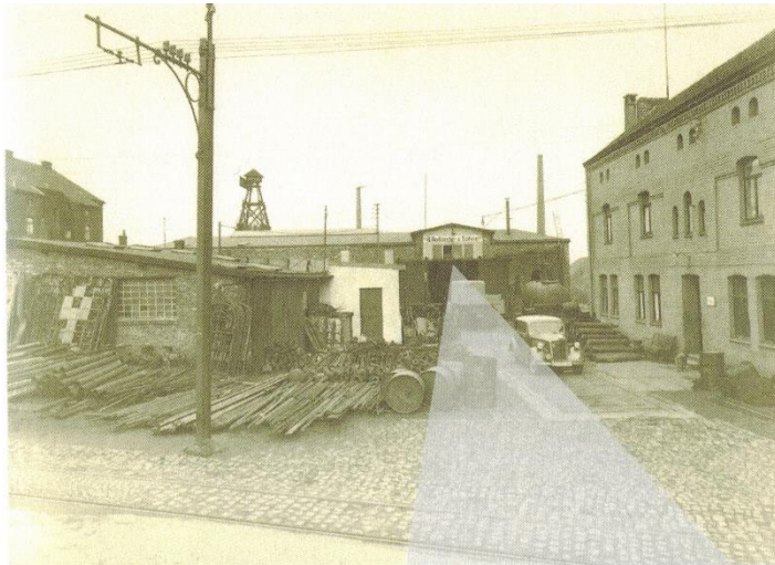
B. Holländer & Söhne (sons) factory in Stolberg, with an enlarged detail of the factory sign