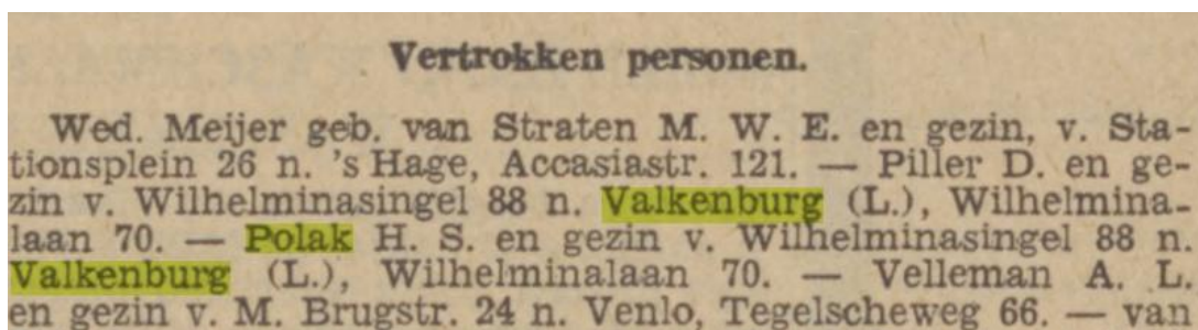
Limburgs Dagblad 7 januari 1933