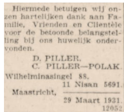
Dankbetuiging - Telegraaf 31 maart 1931