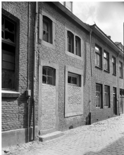
Foto uit 1962 Raamstraat 50 Maastricht.